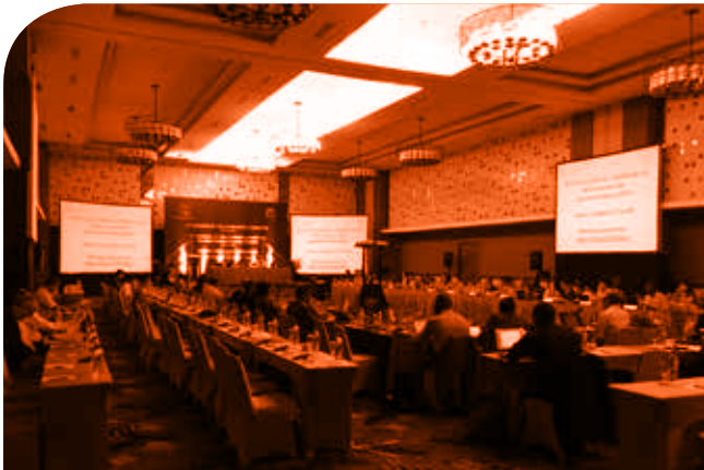
Session du Comité d'application, Yogyakarta, Indonésie

Consulter le règlement intérieur: Règlement intérieur de la CTOI