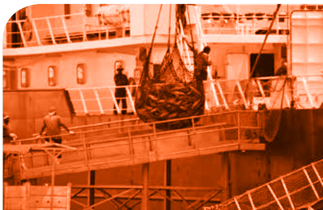
Débarquement de thons capturés par un senneur, Mahé, Seychelles.

Consulter la fiche de mise en œuvre: Fiche - Résolution 01/06 - Programme de document statistique du patudo