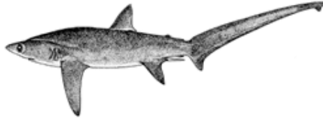
Tableau A 1. État du requin-renard à gros yeux ( Alopias superciliosus ) de l'océan Indien.