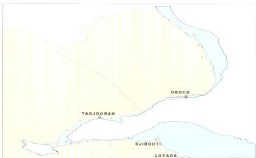
Figure Le plateau continental (en turquoise) de la côte Djiboutienne