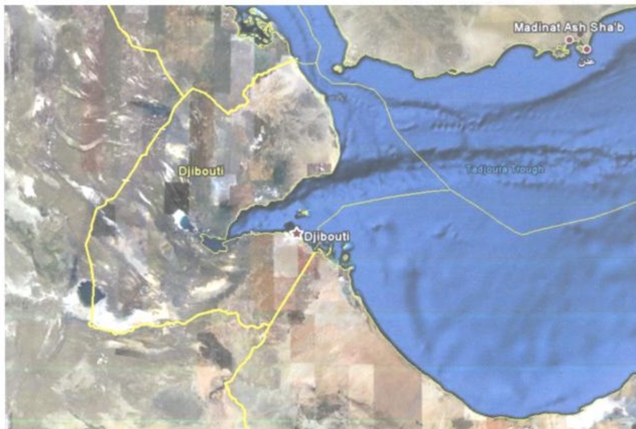
Carte de Djibouti, montrant l'étendue de la ZEE